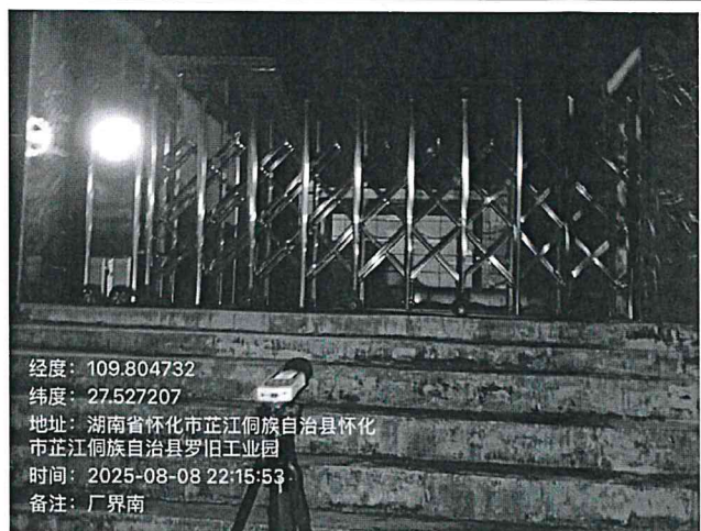
厂界外南侧 1 米处 2#