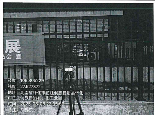
厂界外东侧 1 米处 1#