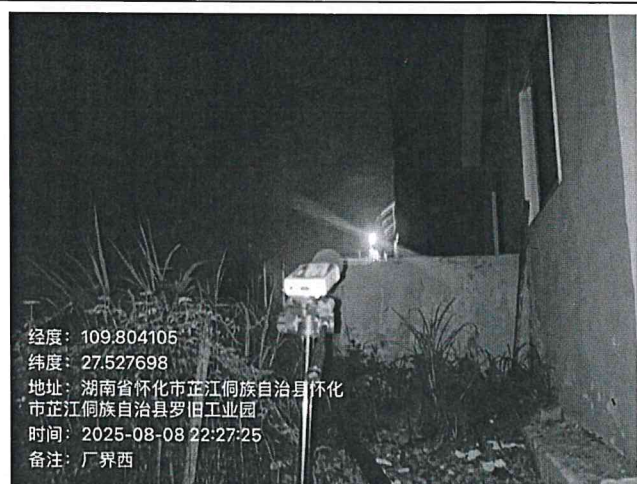
厂界外西侧 1 米处 3#