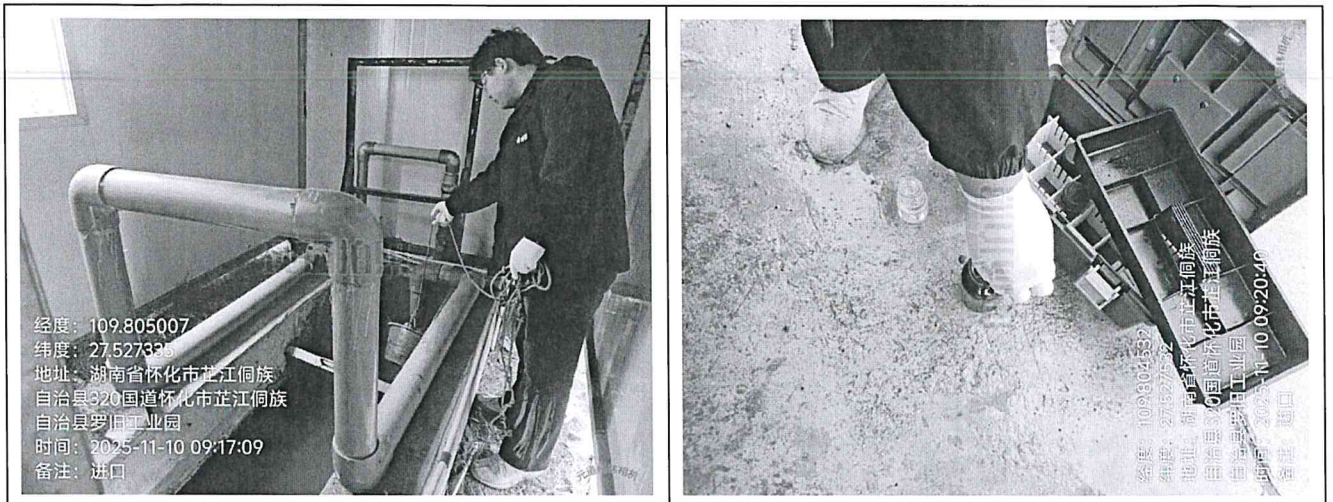
废水总进口 JS001（第一次）