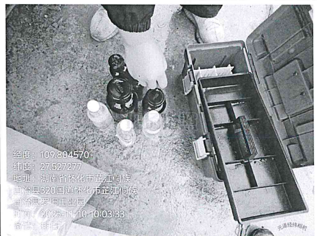
废水总排口 DW001 (第二次)