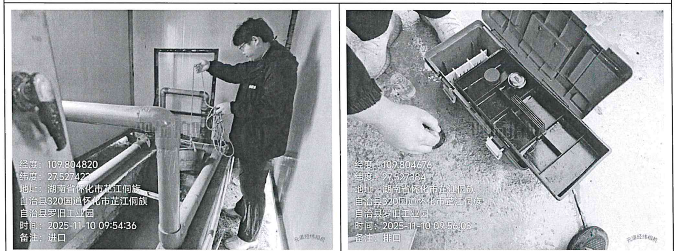
废水总进口 JS001（第二次）