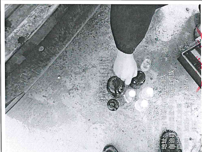
废水总排口 DW001 (第三次)