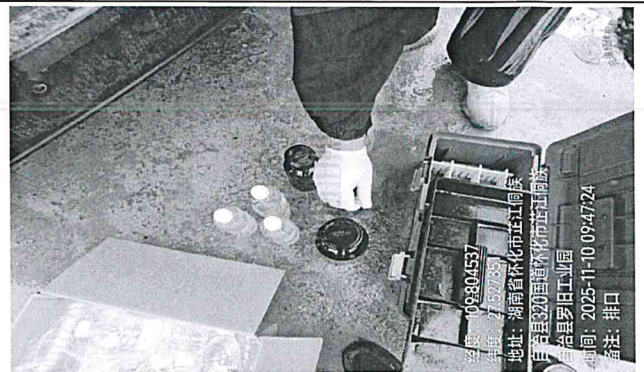
废水总排口 DW001 (第一次)